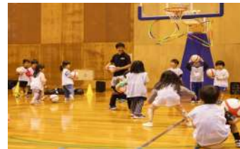
④ バスケットボールにつながる運動