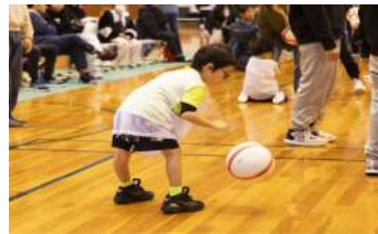
③ ボールあそび（ボールの特性を知る）