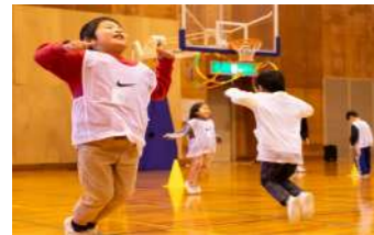
② 基礎運動（各種ステップ）